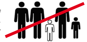
Bild rechts: In der Zahl zur Familienkonstellation können nie mehr als zwei Erwachsene (die Vertragspartner) enthalten sein.

Bild links: Familienkonstellation bezieht sich auf Sorgerecht und Unterhaltspflicht. Bitte nicht verwechseln mit der früher üblichen Haushaltskonstellation.